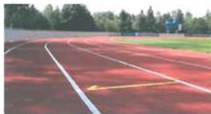
Príklad zlého stavu povrchu: Veľmi znečistený syntetický povrch Príklad dobrého stavu povrchu: Vyčistený syntetický povrch

Okrem syntetického povrchu by sa malo kontrolovať raz za štvrtrok športové zariadenie a vybavenie, najmä aby sa zabezpečila jeho stabilita. Aj poškodené zariadenie a vybavenie môže totiž povrch poškodiť. Poškodené športové zariadenie a vybavenie sa musí byť bezodkladne opraviť alebo vymeniť.