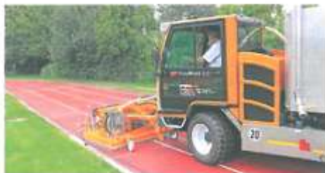
Intenzívne čistenie špecializovanou firmou