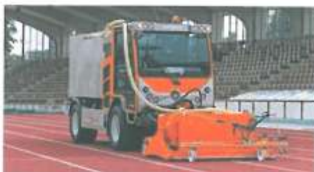
Profesionálne čistenie špecializovanými firmami.

Menšie poškodenia, napr. praskliny, je potrebné ihneď opraviť pomocou súpravy určenej na opravy Polytan repair kit. Všetky značky sa musia, v závislosti od intenzity používania,čas obnoviť.