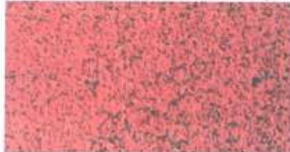
Príklad zlého stavu povrchu: Syntetický povrch pokrytý machom

Ak je syntetický povrch v tieni alebo je ohraničený vegetáciou, tak bude skôr náchylný na obrastanie machom. V takomto prípade je potrebné vykonávať intenzívne čistenie každý rok.