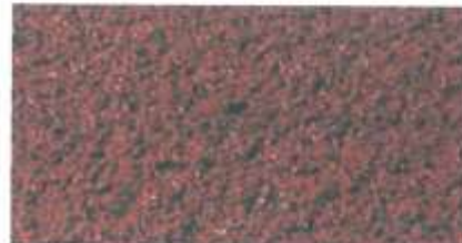
Príklad dobrého stavu povrchu: Čistý povrch

V prípade povrchov priepustných pre vodu, ktoré neboli určitý čas vyčistené, existuje riziko, že rastliny sa môžu po intenzívnom čistení rozrastať. Semená prenikajú v priebehu rokov hlbšie a hlbšie do povrchu a takto silne znečistené povrchy nebude schopné úplne vyčistiť ani intenzívne čistenie. Preto je nevyhnutné čistiť syntetické povrchy v pravidelných intervaloch.