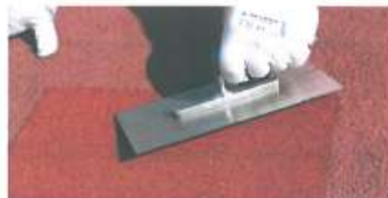
Opravený syntetický povrch