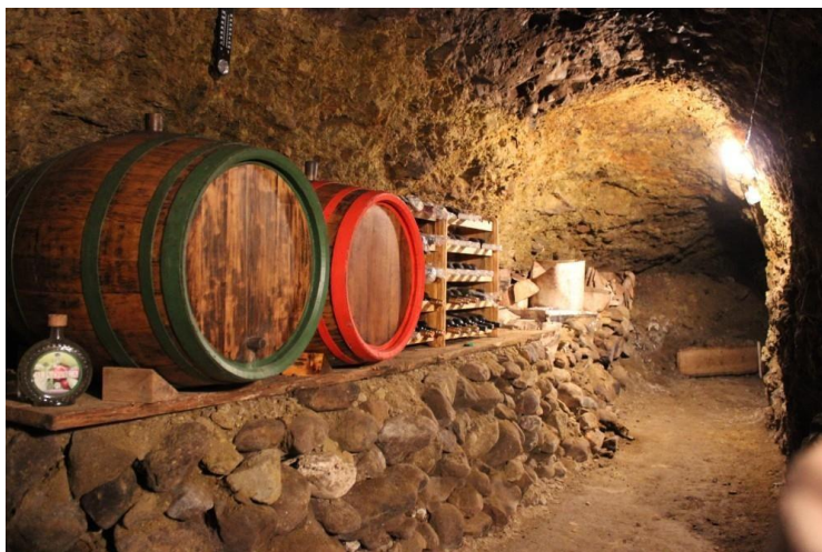
+IMG_8267foto ML zm.JPG