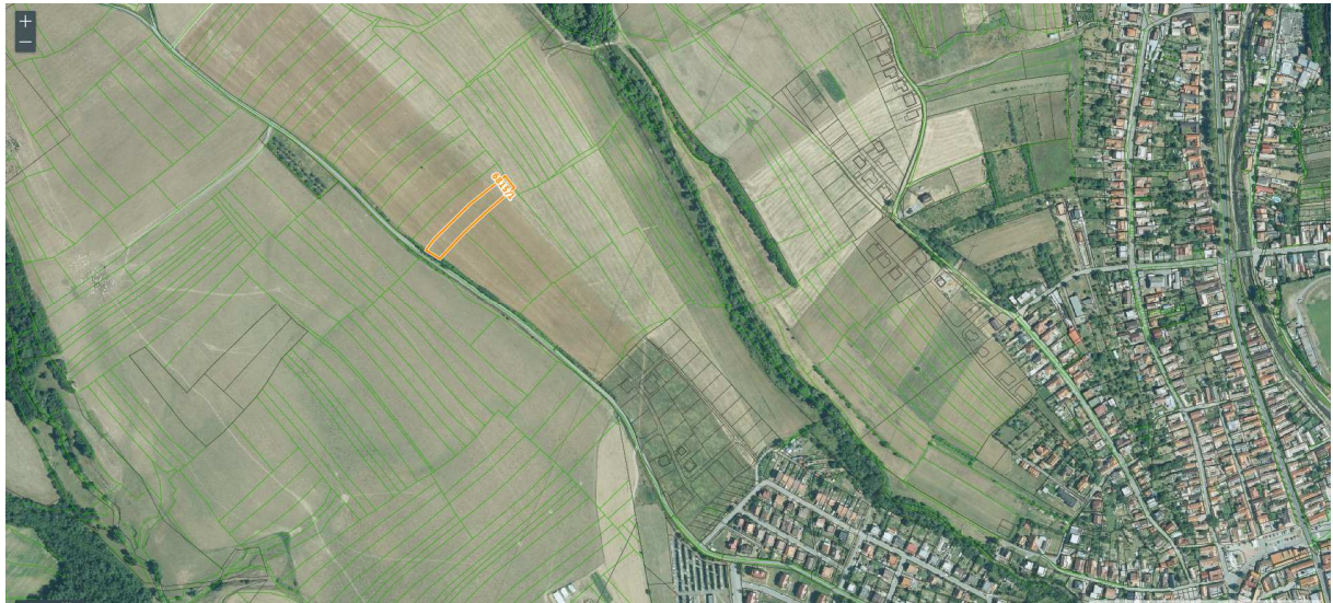
parcela registra E č. 6815/1 o výmere 3635 m 2 , druh pozemku orná pôda