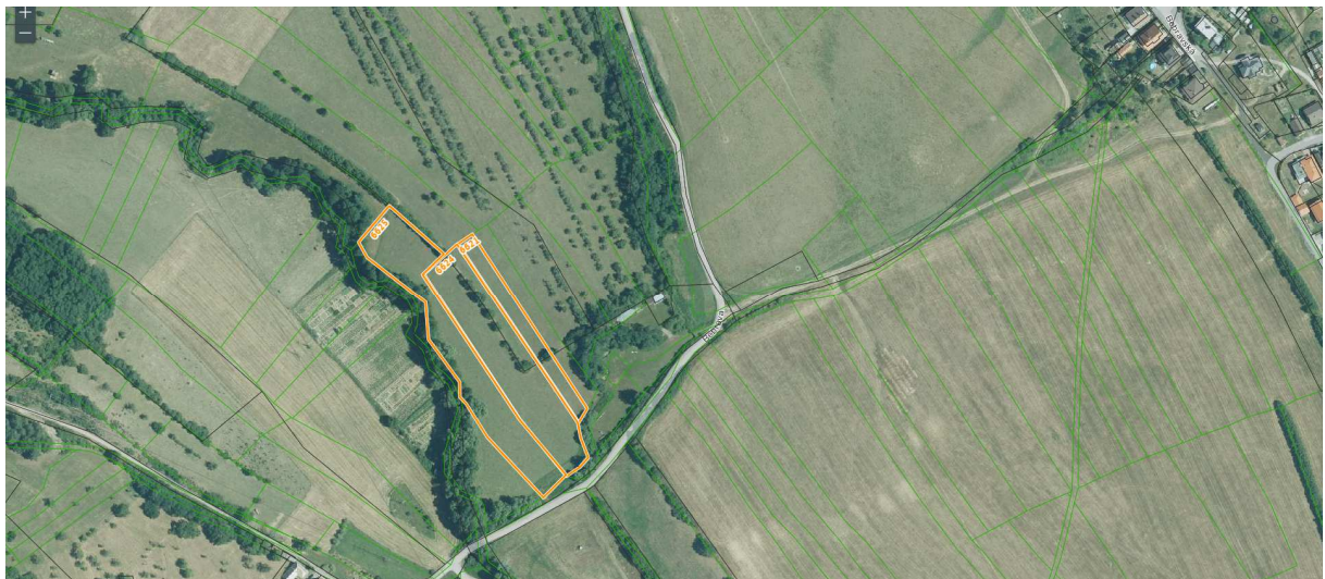
parcela registra E č. 6621 o výmere 1805 m 2 , druh pozemku orná pôda parcela registra E č. 6624 o výmere 5915 m 2 , druh pozemku orná pôda časť parcely registra E č. 6625 o výmere 5873 m 2 , druh pozemku orná pôda (z dôvodu že na časti pozemku sa nachádza vodný tok)