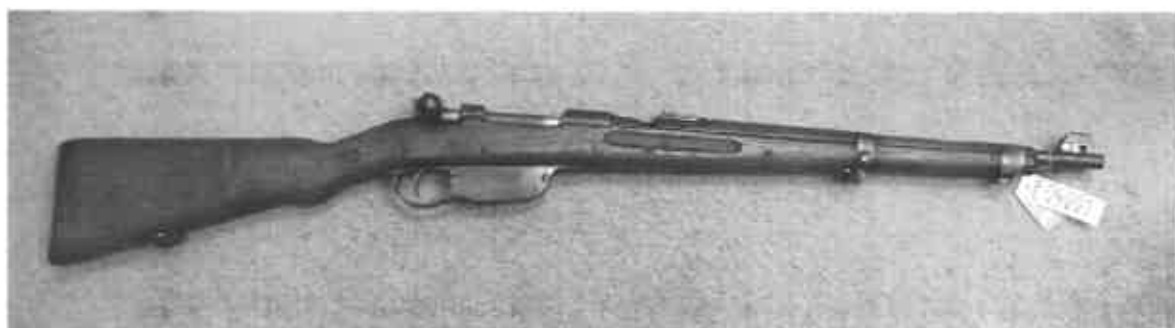
E04001, Karabína vz.95, výr. č. 7184D.