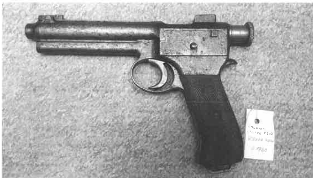
E 01920, Pištoľ Roth-Krnka vz.07, výr. č. XXX42.