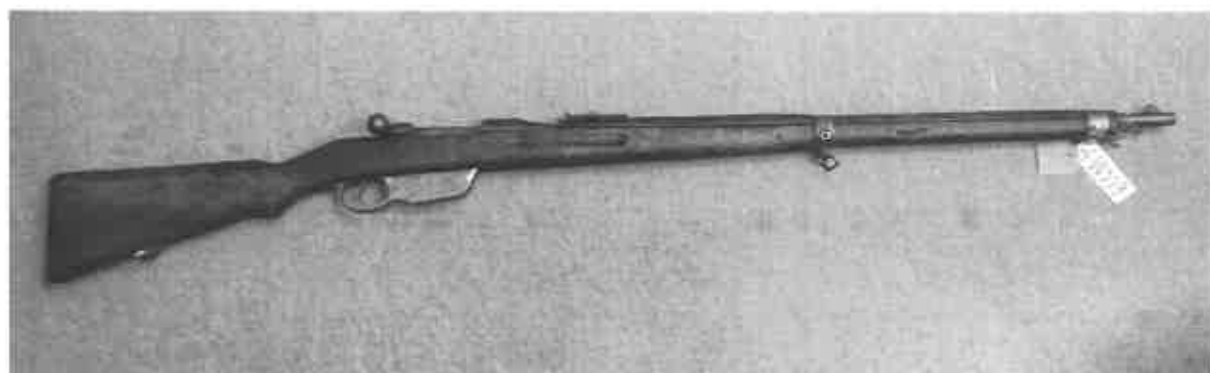
E 00559, Puška vz.95, výr. č. 8664F