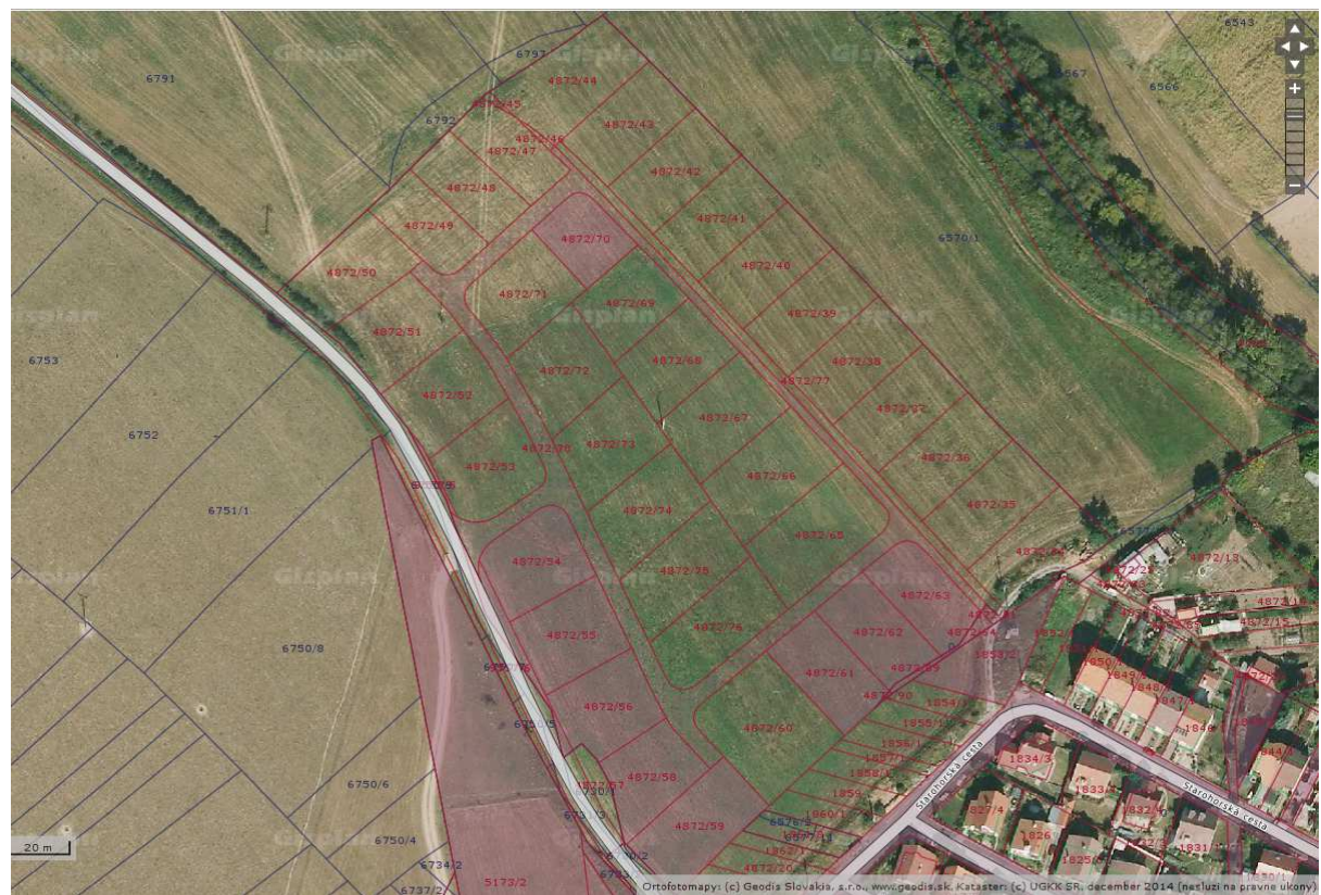
Lokalita Nad Klipochom