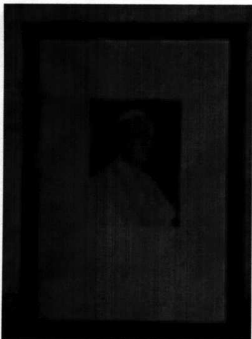
11. Fotografia zarámovaná pápeža Pavla IV. (20. stor.)