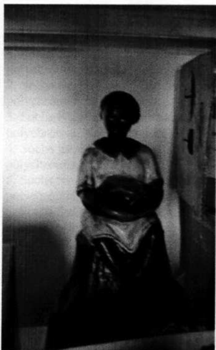
13. Socha černoška – prijímateľa darov pri Jasličkách, sadra (20. stor.)