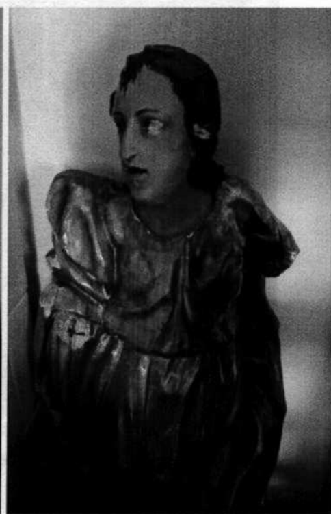
6. Sv. Ján Evanjelista (18. stor.)