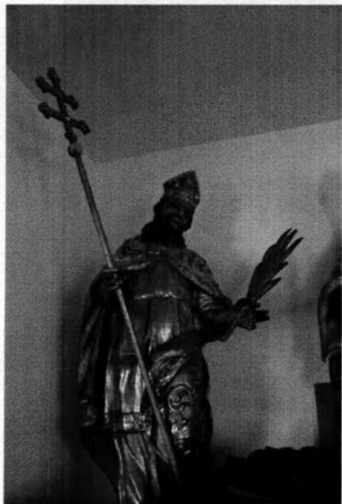
1. Sv. Vojtech? (18. stor.)