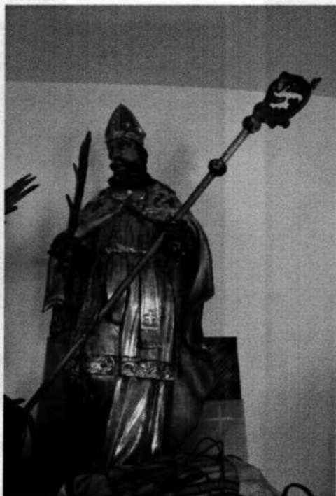
2. Sv. Gerhard? (18. stor.)