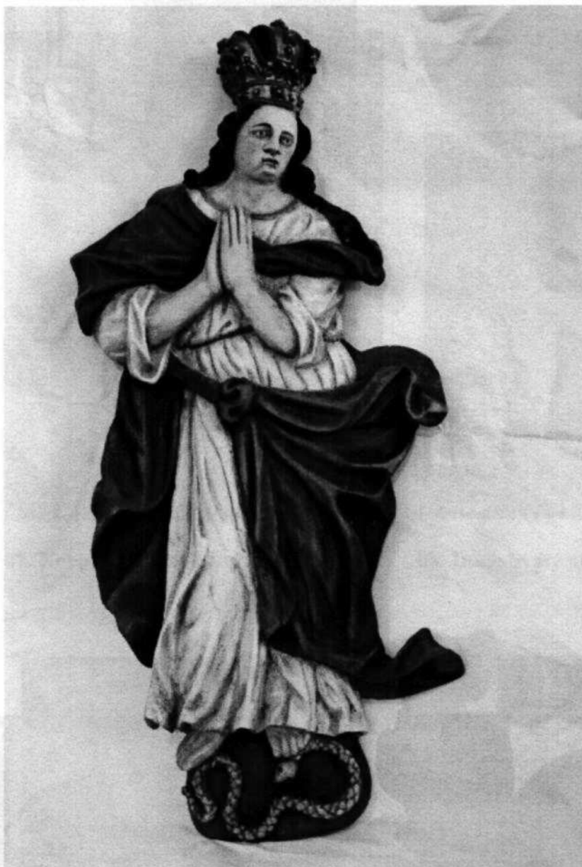
15. Reliéf Immaculaty, drevo, polychrómia (18. stor.)