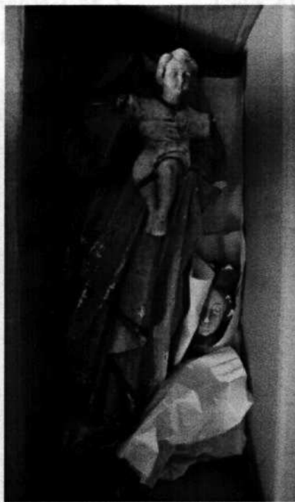
10. Panna Mária s Ježiškom zo zvoničky na laze Gerlach / Čekovce (20. stor.)