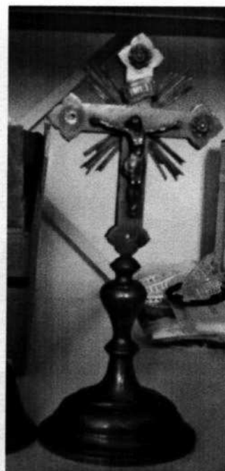
12. Mosadzný kríž (20. stor.)