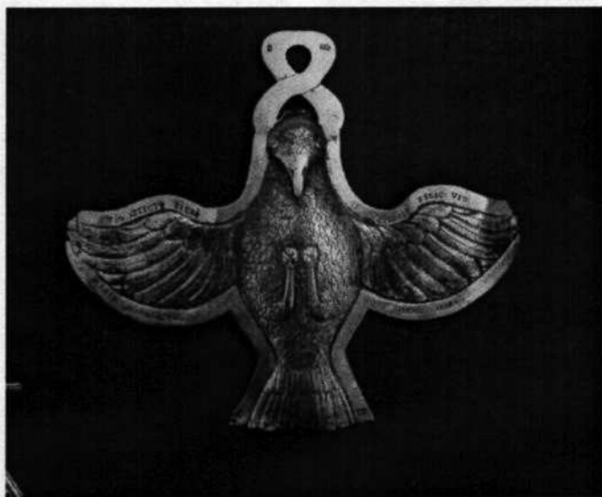
08. Duch Svätý ako holubica, mosadz, (20. stor.)