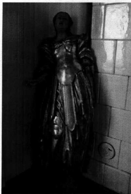
4. Sv. Margita? (18. stor.)