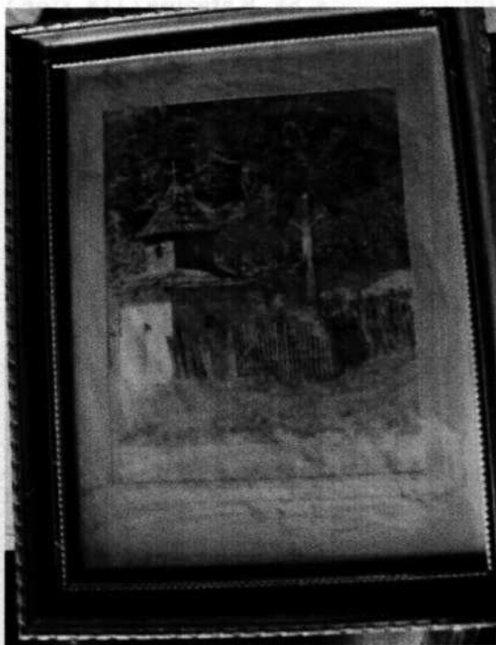
09. Zarámovaná fotografia zvoničky niekde pri Krupine? (20. stor.)