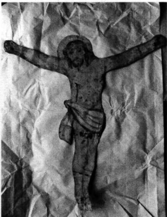
07. Korpus Krista (19. storočie?)