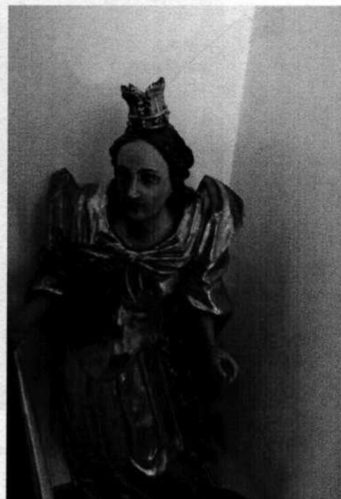
3. Sv. Katarína? (18. stor.)