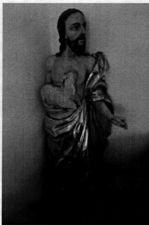
5. Sv. Ján Krstiteľ (18. stor.)